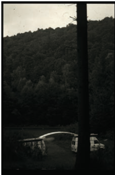
Ponticelli 18/08 Installation