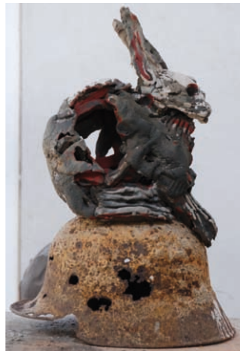
Lapin sur casque, 2008 Sculpture © Adagp Paris 2008